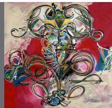
Jonas Deubelbeiss Bilder

Ausstellung Samstag, 26. Oktober 14 – 19 Uhr Sonntag, 27. Oktober 11 – 15 Uhr Matinée ab 11 Uhr mit Sam Stauffer Celtic-Folk-Sound mit Gitarre, Whistles und Gesang