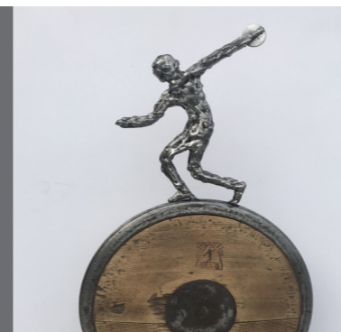
Reto Baumann Eisenobjekte

Immer wieder faszinieren mich alte Eisenteile, gezeichnet vom vorherigen Leben, deren Geschichte und Funktion. Aus der Alteisenmulde, in den Ferien gefunden, oder von Bekannten zugetragen – sie inspirieren mich, mit ihnen etwas „Neues“ zu kreieren. Verschweisst, geschraubt, zurechtgebogen, kombiniert mit Restmetall, Fundstücken aus Holz und Acryl, entstehen skurrile, witzige und auch hinterfragende Objekte, mit einer neuen Geschichte. www.toland.ch